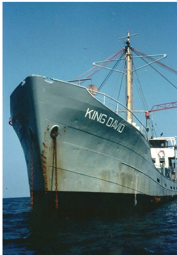
King David in internationale wateren