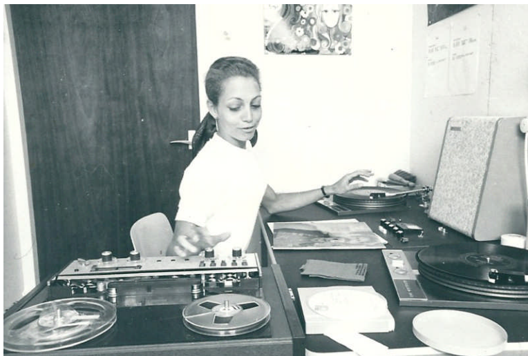
Studio in Bussum