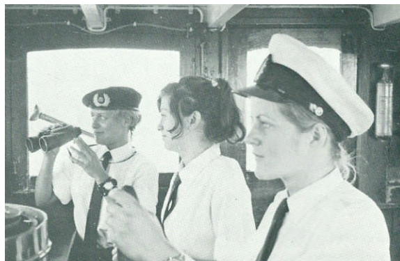
Liechtensteinse marine op de brug

Als je het betreffende interview nog eens goed doorleest merk je wat enorm veel er veranderd is in de meer dan 41 jaren nadat het werd afgenomen en is