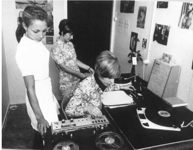
Eén van de studio's in Bussum

wel. We lieten het met opzet onvertaald. Men mag zelf uit de betekenissen kiezen en ik zal het niet verbieden als dan het accent op 'kapitaal' valt."