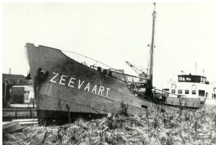
Het toekomstige zendschip onder oude naam Zeevaart

Als we het hebben over de zeezender Capital Radio, dan is er een aantal zaken dat meteen boven water komt. Gedachten als: een afwijkend muziekformaat, idealistische achtergrond, unieke ringantenne, veel pech onderweg en vooral zeer kort in de ether. Het zendschip MV King David werd in 1970 voor de kust van Noordwijk verankerd en begon op 1 juni van dat jaar met onregelmatige testuitzendingen via de 270 meter. De aanwezige zendapparatuur gaf de mogelijkheid met een vermogen van 10 kW de uitzendingen de ether in te sturen, hoewel algemeen wordt aangenomen dat er nooit meer dan 1 kW aan uitgaand vermogen is gebruikt. Op 1 september 1970 kwam men officieel in de ether maar na slechts een periode van ruim een week werden programma's, in zowel de Nederlandse als Engelse taal, te hebben aangehoord dienden we vanaf 9 september van het jaar al teleurgesteld, daar Capital Radio wegens technische problemen meer niet dan wel in de ether was.