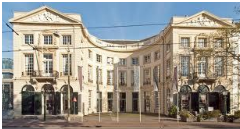
Koninklijke Schouwburg Den Haag

Begin 1963 werd er in het kort stilgestaan bij een onderzoek betreffende het eventuele teruglopen van het aantal bezoekers aan toneelvoorstellingen. Het resultaat van het onderzoek wees uit dat de televisie beslist geen ongunstige invloed uitoefende op het bezoek aan toneelvoorstellingen. Het resultaat was vastgelegd in een verslag uitgegeven in opdracht van de directie van de Koninklijke Schouwburg in Den Haag.