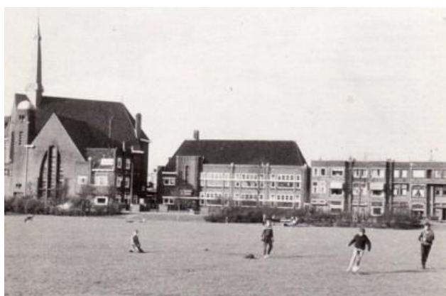
DRIEHOEKJE GRONINGEN 1961

Zo rond 1961 gingen we onze blik verbreden en werd er veel gevoetbald op het Bernouilleplein maar ook op het Driehoekje. Dit was een heel groot grasveld met vele struiken er omheen waar ruimte voor vliegeren, voetbal en ander balspel mogelijk was. Het was destijds precies gelegen ten zuiden van het Bodeterrein op de plek waar anno 2010 vele gebouwen al jaren staan als onderdeel van het Universitair Medisch Centrum Groningen, in die tijd nog gewoon Academisch Ziekenhuis genoemd.