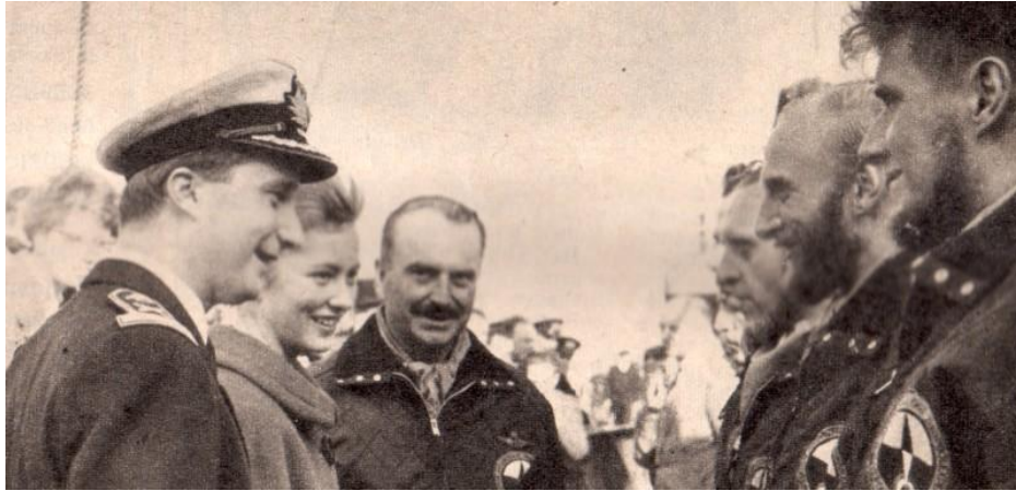
PRINS ALBERT EN PRINSES PAOLA ONTVANGEN HET ONDERZOEKSTEAM IN 1961