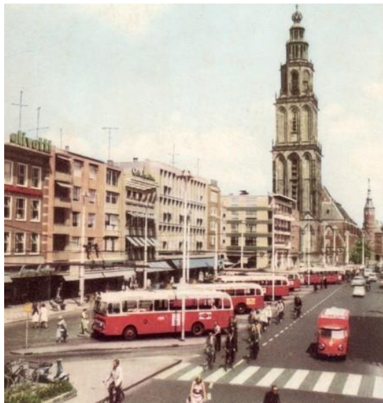
GROTE MARKT NOORDZIJDE

De in de volksmond genoemde 'knipperbol' heette officieel de 'Belisha Beacons' en werden voor het eerst geïntroduceerd in het Verenigd Koninkrijk, Ierland en de voormalige Britse kroonkolonies Singapore en Hong Kong. Ze waren vernoemd naar Leslie Hore-Belisha, die leefde van 1895-1957. Hij voerde als minister voor Transport de voorganger van de zebra in; een oversteekplaats die werd afgebakend door grote metalen stukken in het wegdek. Dit gebeurde vanaf het jaar 1934. Een tweede zebra, maar dan zonder knipperbol, kwam in Groningen te liggen bij de toenmalige centrale busstopplaats aan de noordzijde van de Grote Markt.