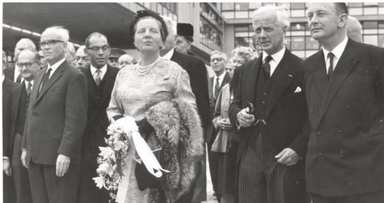
JULIANA OPENT GEBOUW WERELDOMROEP

In Hilversum werd er driftig gebouwd aan het toenmalige nieuwe complex van Radio Nederland Wereldomroep, dat werd gebouwd na het idee van de architecten: J. H. van den Broek en J.B. Bakema. Een gebouw dat er van de lucht uit gezien eruit zou zien als een 'romp van een vliegtuig met in zijn staart het studiocomplex'. Onze toenmalige Koningin Juliana opende het nieuwe gebouw van de Wereldomroep, gehuisvest aan de Witte Kruislaan. Het oude onderkomen aan de Bothalaan werd daarmee verlaten, voor het nieuwe gebouw, dat voor die tijd bijzonder functioneel van opbouw was. Onder de kantoorruimte bevinden zich de opname- en uitzendstudio's.