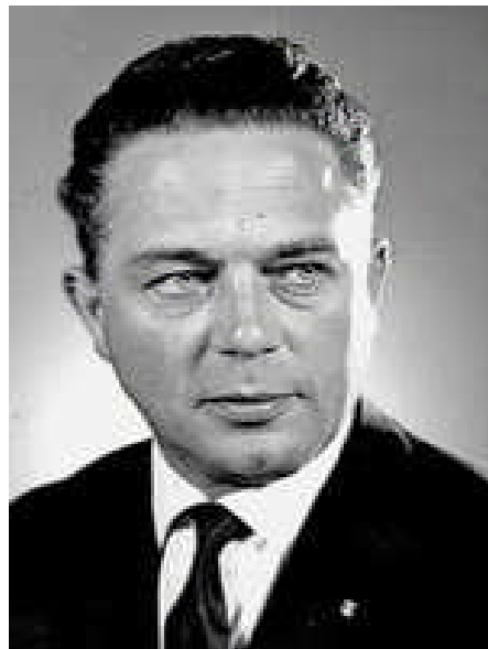
Minister President Marijn

Toen het op een uitgebreid debat aankwam, dat op de 19e maart 1963 een aanvang nam, bleek echter dat naast de unanieme mening van de regering, alleen de VVD-fractie in de Tweede Kamer geheel dezelfde mening te hebben, namelijk de invoering van een tweede televisienet, dat op commerciële basis zou moeten worden gerund. Er was binnen de grote partijen als KVP, CHU en PvdA, een duidelijke breuk tussen vóór en tégenstanders, terwijl erbij de volksvertegenwoordigers, die namens de kleinere partijen zoals SGP, PSP en CPN hun meningen en stemming duidelijk maakten, een totale tegenstand was tegen de plannen van de toenmalige regering. Na enkele dagen van debatteren werd het duidelijk dat het plan niet door de Tweede Kamer zou worden geaccepteerd en afgesproken werd de toekomst van de televisie in Nederland en het eventueel introduceren van commerciële televisie, in handen te leggen van een nieuw te vormen regering, die na de verkiezingen van mei 1963 zou worden geïnstalleerd.