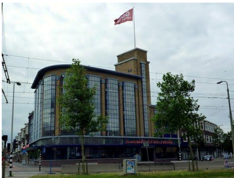
Complex Wereldzendingen Den Haag